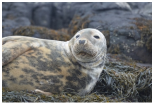
出海看野生小海豹