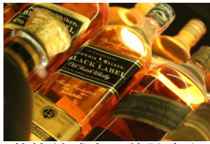
苏格兰威士忌体验中心