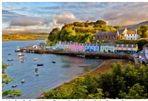
波特里岸边的彩色房子