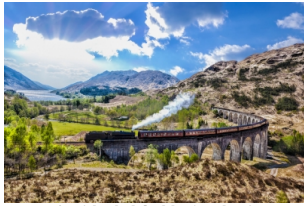
哈利波特蒸汽火车

早餐后，我们将在天空岛稍作停留，自由活动。随后，前往Mallaig乘坐【哈利波特蒸汽火车】，抵达威廉堡。或驱车前往哈利波特拍摄地——【格伦芬南铁路高架桥】游览，夜宿威廉堡。