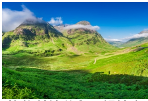
格伦科峡谷和三姐妹山